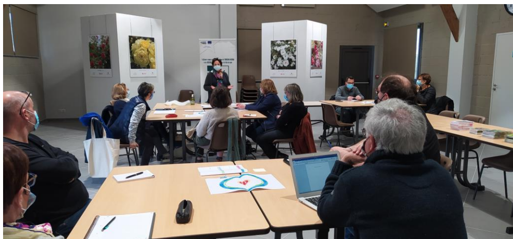
Concertation à Yèvre-le-Châtel

Aussi, chaque action menée visera à réduire les écarts entre les personnes éloignées et la société dans laquelle elles doivent être incluses, ce qui impactera de manière bénéfique notre quotidien à tous.